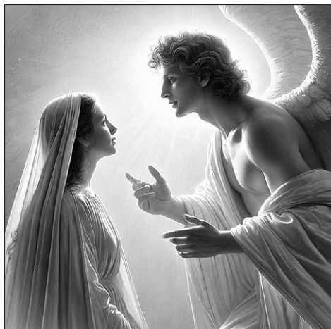
Obrázek vytvořený umělou inteligencí

Bůh mu dá trůn jeho otce Davida. Na věky bude kralovat nad domem Jákobovým a jeho kralování nebude konce.” Marie řekla andělovi: „Jak se to stane, vždyť nepoznávám muže?” A anděl jí odpověděl: „Duch Svatý přijde na tebe a moc Nejvyššího tě zastíní; proto také to Svaté, co se z tebe narodí, bude nazváno Syn Boží. Hle, tvá příbuzná Alžběta — také ona počala ve svém stáří syna a toto je šestý měsíc tě, která je nazývána neplodnou. Neboť u Boha nebude žádná věc nemožná.” Marie řekla: „Hle, jsem Pánova otrokyně; nechť se mi stane podle tvého slova.” A anděl od ní odešel. (L 1,26–38)