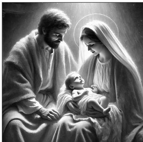
Obrázek vytvořený umělou inteligencí

Ignatius z Antiochie , pokládáný za žáka apoštola Jana, v Dopise Efezským z roku asi 110 napsal: Našeho Boha Ježíše, který je pomazaný, nosila Marie v životě podle Božího plánu, ze semene Davidova a Ducha svatého. (...) A vládci tohoto věku zůstalo skryto Mariino panenství a její porod... (18, 2–19,1)