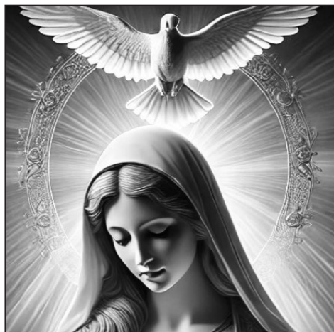
Obrázek vytvořený umělou inteligencí

Narození z panny je však způsobem, jakým bylo dokonáno Boží vtělení. Vý-