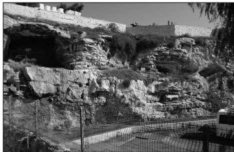
Pohled na možnou Golgotu ze Zahradní hrobky

pohledu z města tento kopec mohl vypadat jako lebka.