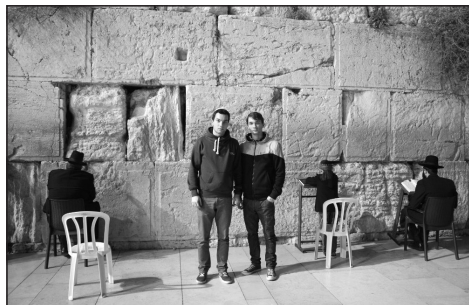
Před Západní zdí

Kristus však přinesl za hříchy jedinou oběť, navěky usedl po pravici Boží... Tak jedinou obětí navždy přivedl k dokonalosti ty, které posvěcuje. (Žd 10,3–4.12.14)