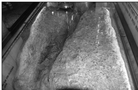
Vápencová skála v Chrámu Božího hrobu, kde mohla být Golgota

byl ukřižován na místě zvaném Golgota. Když přišli na místo, které se nazývá Lebka, ukřižovali jej i ty zločince, jednoho po jeho pravici a druhého po levici. (Lk 23,33) O přesném místě Kristova ukřižování se vedou diskuze. V letech 326–335 nechal římský císař Konstantin I. Veliký postavit chrám Svatého hrobu jako památku nad Ježíšovým hrobem poblíž Golgoty. Podle Janova evangelia bylo místo poprav velmi blízko od hrobu, kam byl Pán Ježíš pochován: V těch místech, kde byl Ježíš ukřižován, byla zahrada a v ní nový hrob, v němž dosud nikdo nebyl pochován. (J 19,41)