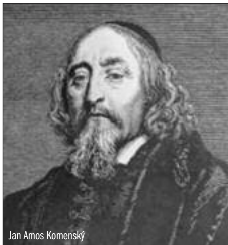
Jan Amos Komenský

Ale aby to nebylo tak černé resp. černobílé.