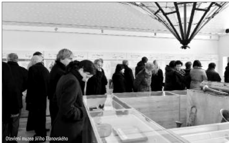
Otevření muzea Jiřího Třanovského

Slovenský kazatel a literární historik Ján Mocko (1843-1911) shrnul význam Třanovského zpěvníku těmito slovy: