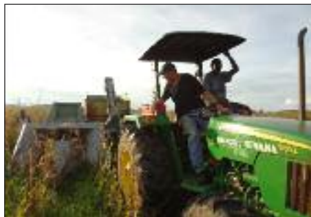
Sklizeň kukuřice v Bunii

cesu bylo zapojeno 700 dětí, měsíční podpora se pohybovala ve výši přes 5000 USD. V první polovině 2014 je to již asi 700 USD měsíčně a ve druhé polovině t. r. se očekává, že středisko již bude soběstačné (viz graf).